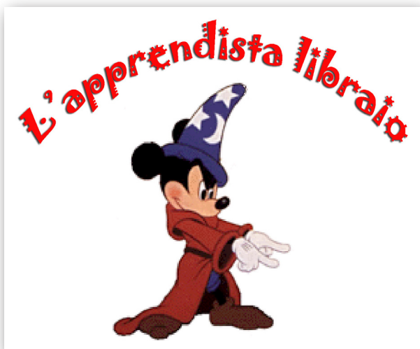
una rubrica di Stefano Amato (Ottava parte, dicembre 2008)