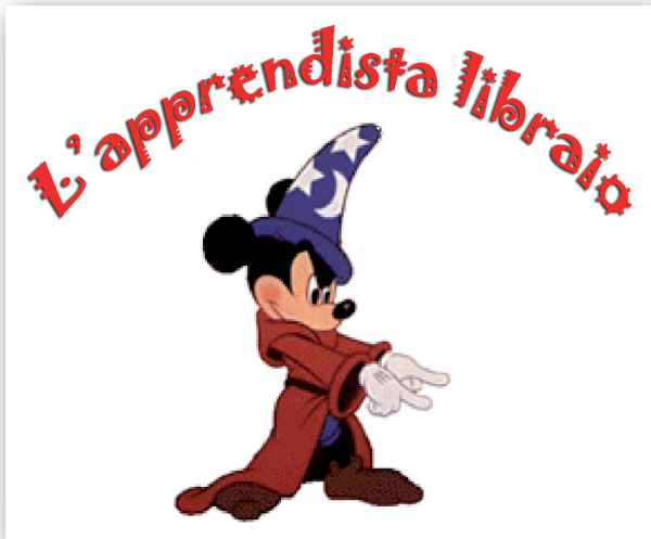
una rubrica di Stefano Amato (Settima parte, novembre 2008)