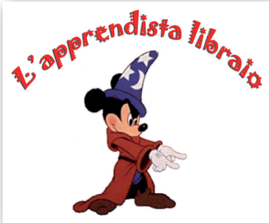
una rubrica di Stefano Amato (Quarta parte, agosto 2008)