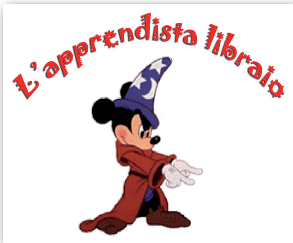
una rubrica di Stefano Amato (gennaio 2010)